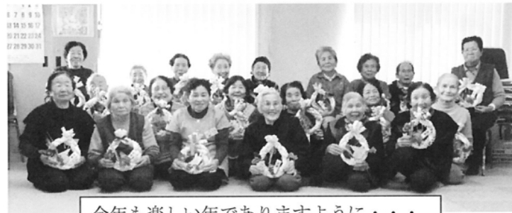
今年も楽しい年でありますように・・・

あけましておめでどうございませう! 昨年はコース変更に伴いご迷惑をおかけいたしました「友達が増えたく〜!」というお声もいただき、大変うれしく感じております。また、新しい職員も加わり、出会いの年だったように思いました。 まだまだ勉強不足ではありますが、皆さんにビシバシ鍛えられながら頑張っております。 今年もよろしくお願ひ申し上げます!