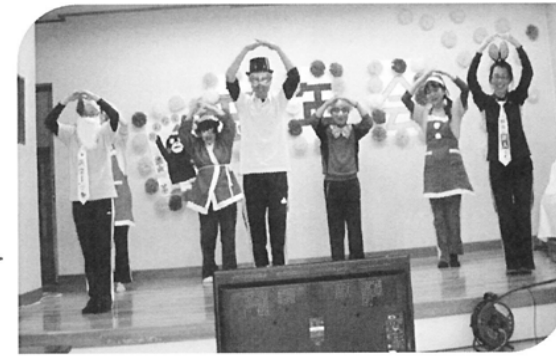
職員一丸となって、 渾身の?! 踊りを披露!

12月は大忘年会で盛り上がりました! 歌、踊り、大正琴、大道芸などたくさんの演目に皆さんの笑顔が絶えない、楽しいひとときとなりました。 職員も踊りに大ハッスル!! 大歓声が沸き起こりました(o^o)