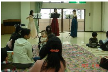
フルートの音色に癒されます