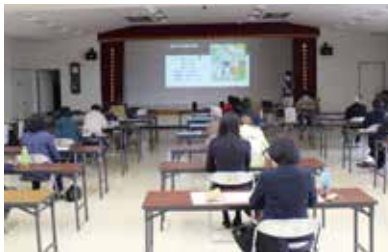
吉住氏の話に熱心に聞く参加者