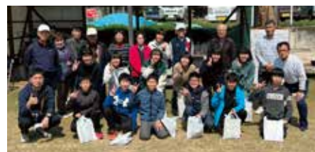
地域の皆さんに囲まれて