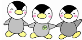
民生委員児童委員マスコット ミンジー

地域住民の身近な相談相手となり、支援を必要とする住民と行政や専門機関をつなぐパイプ役です。心配ごとや不安、困ったことがあるときは、お気軽にご相談ください。