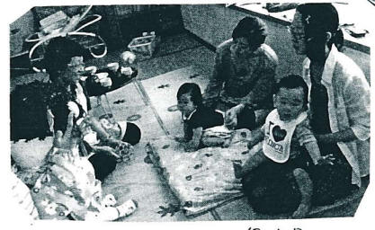
おロパックリ ガンエちゃんに興味湧々

9/30 歯科講座を行 いました。子ども達だけで なく、家族全員で虫歯 を予防しようというお話が あり、お母さん方もご自身の 歯の健康について、しつこ く勉強されました。