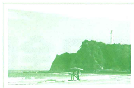
塩屋埼灯台 (いわき市)

新幹線や東北自動車道が通り、交通の便に優れたエリアです。「三春滝桜」や「花見山」など多くの花の名所があるほか、様々な種類のくだもの産地となっています。また、「磐梯熱海温泉」を始め、歴史のある古湯の「飯坂温泉」など温泉も豊かで人々を癒やしています。