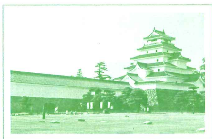
鶴ヶ城 (会津若松市)

福島の桃は全国有数の生産量を誇り、皇室の献上桃として知られる。その他、りんご・梨・さくらんぼ等、果物王国でもある。米どころとしても知られる福島県は、会津地方をはじめ、全国的に知名度の高い酒蔵も多数ある。