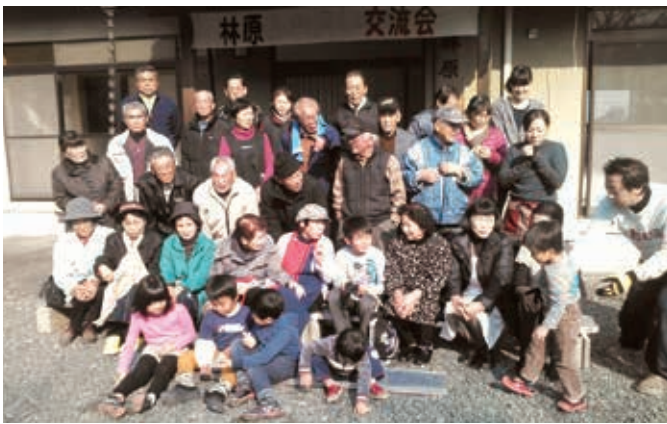
楽しいことも一緒に（林原区）

マップ作成だけでなく、防火訓練・避難訓練を開催したり、炊飯袋（ハイゼックス）を使った炊き出しや防災の講演会を開催したりした地区もあります。また、子ども達も参加できるような防災の取り組みと交流会を組み合わせた地区もありました。 この機会に皆さんの地域でも取り組んでみませんか？ コロナウイルス感染防止策を施しながら、出来ることから始めていきましょう。 菊池市社協では、地域における防災見守りマップ作りや防災の取り組み等をお手伝いします。ぜひ、お気軽にご相談ください。