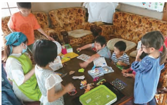
▲ひのくにスマイル食堂の様子

ひのくにスマイル食堂は老若男女問わず、みんな笑顔で楽しみながら活動しています！どうぞお気軽にご参加ください！お待ちしております！