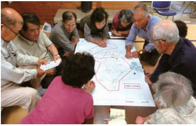
防災見守りマップ作りの様子（南桜ヶ水区）

こんな時だからこそ「防災」をキーワードに、地域のこと、支え合いのことを考えてみませんか？