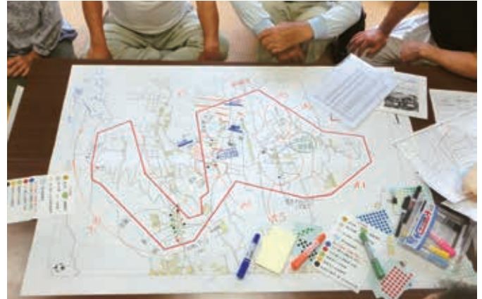
マップ作りから地域での見守り体制も考えましょう