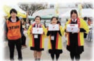
募金お願いします！

今年も10月から全国一斉に赤い羽根共同募金運動が始まります。 菊池市では、毎年区長さんをはじめボランティアさんや各種団体、企業、学校等多くの皆様のご協力により募金活動が行われています。