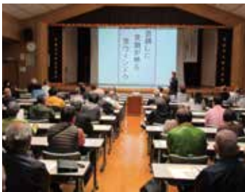
“笑い”の絶えない講演会でした