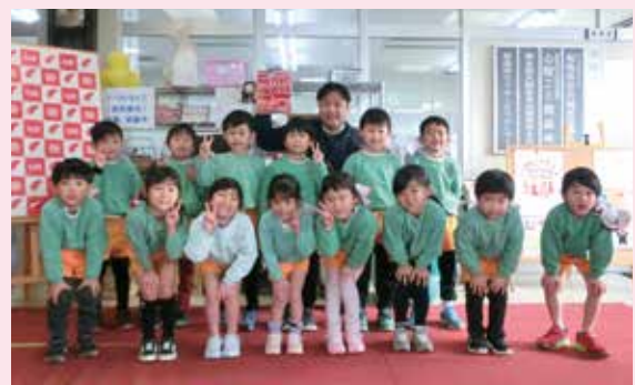
菊池第2 さくら幼楽園