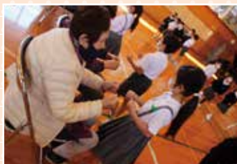
ゲータッチであいさつ