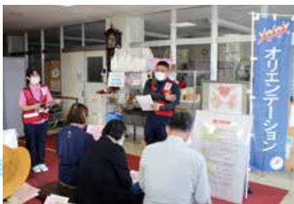
ボランティアさんへの説明の模擬訓練

12月1日、菊池市と災害ボランティアセンター設置に関する協定を締結しました。これにより、発災後の災害ボランティアセンターの設置と運営がより円滑にいくことが期待されます。