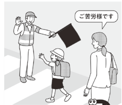
あいさつしながら