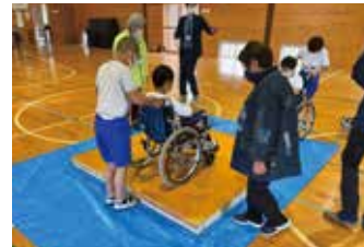
サポーターさんに見守られる子ども達