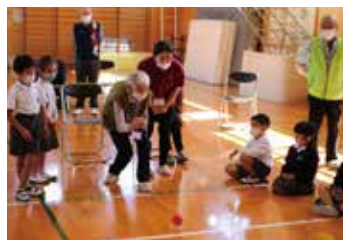
花房地区（子どもと交流）