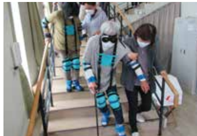
サポーター養成講座の様子