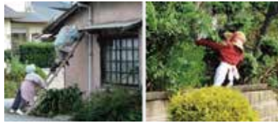
防犯にも役立つかわしです（事例）