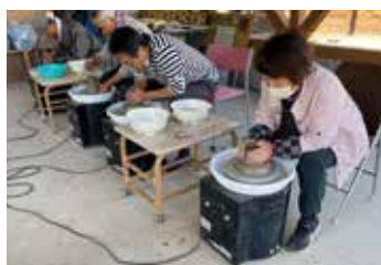
荒牧区（陶芸・趣味）