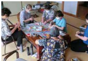
蟹穴区（手芸・趣味）