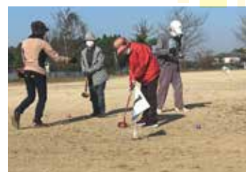
桜山（グラウンドゴルフ）