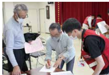
活動場所の確認をするボランティアさん役