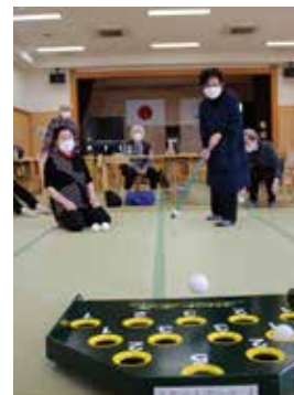
立町区（レクリエーションゲーム）