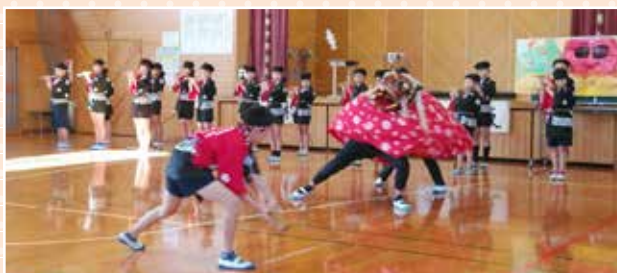
獅子舞の披露を通じた世代間交流

花房地区では、地区社協の委嘱により、11月末で退任された民生委員児童委員を「協力員」として位置づける取組みをスタートさせました。協力員が新しい民生委員児童委員をサポートすることで、切れ目ない見守りや支援が継続できることが期待されます。