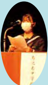
音訳ボランティア「ひこばえ輪々の会」の皆さん