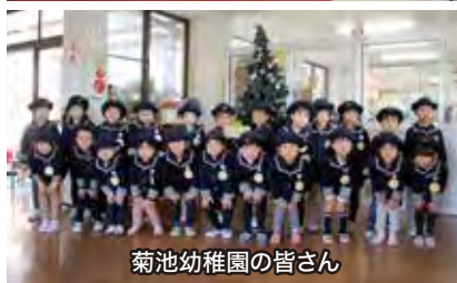
菊池幼稚園の皆さん