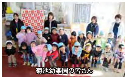
菊池幼稚園の皆さん