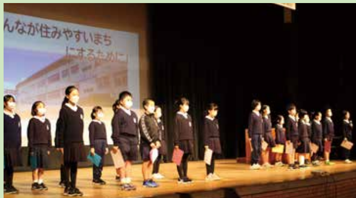
隈府小学校 4年生のみなさん

自動販売機にもUDがありました。菊池市内の身近な ところでたくさんのUDを見つけました。