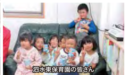
泗水東保育園の皆さん