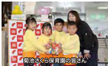
菊池さくら保育園の皆さん