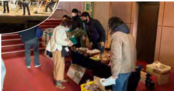
ふくし団体による物品販売の様子