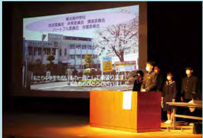
菊池南中学校のみなさん