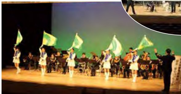
警察音楽隊による演奏