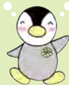
民生委員児童委員 マスコット ミンジー

地域住民の身近な相談相手となり、支援を必要とする住民と行政や専門機関をつなぐパイプ役です。心配ごとや不安、困ったことがあるときは、お気軽にご相談ください。