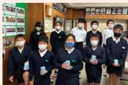
七城小学校の皆さん