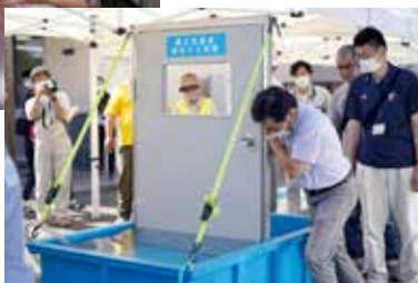
浸水時のドア開閉体験