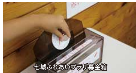
七城ふれあいプラザ募金箱