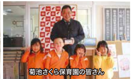
菊池さくら保育園の皆さん