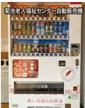
菊池老人福祉センター自動販売機