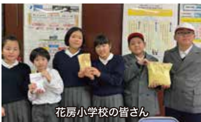
花房小学校の皆さん