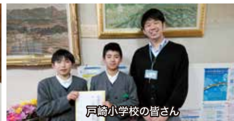
戸崎小学校の皆さん