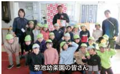
菊池幼稚園の皆さん