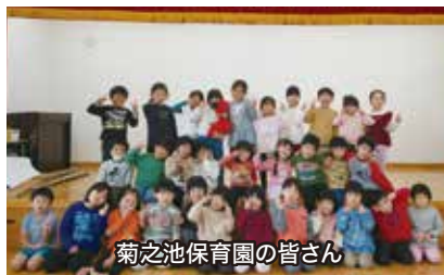
菊之池保育園の皆さん