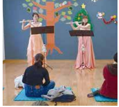
みっちゃんのおしゃべりコンサート