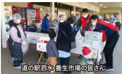
道の駅泗水 養生市場の皆さん