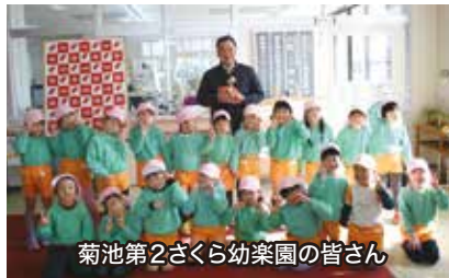
菊池第2さくら幼楽園の皆さん