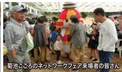
菊池こころのネットワークフェア来場者の皆さん