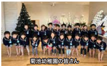
菊池幼稚園の皆さん