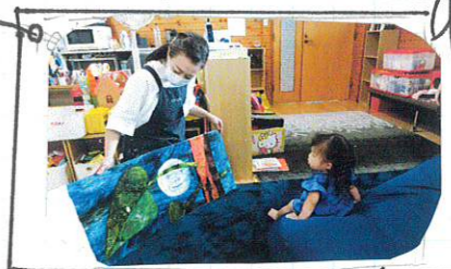
おはなしのつばさの様子

ひなたぼこ ひなたぼこ、この入口に七夕の竹を たてています。お子様やお母様の願い事が 下げられています。楽しい家庭と健やかな 成長を、スタッフ一同も願っています。 みんなでお遊びに来てね!