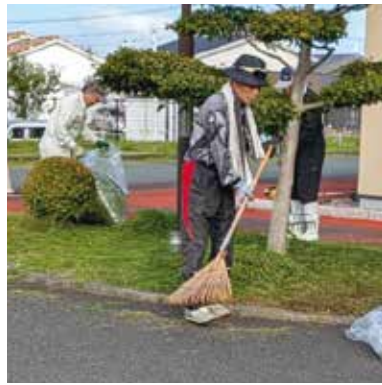
菊池市老人福祉センター除草作業