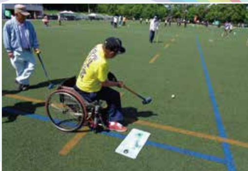
熊本県障がい者グラウンド・ゴルフ大会の様子

菊池市身体障害者福祉協議会は、身体障がい者の方々の生活の安定と福祉の増進を図ることを目的に活動している団体です。赤い羽根共同募金の助成金を活用して、各種スポーツ大会への参加や研修旅行など楽しい行事を行っています。また、菊池市内の協議会協力店では各種割引などの特典も受けられます。