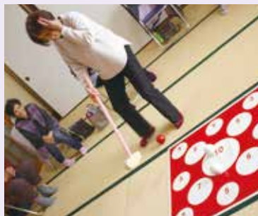
レクリエーションで大笑い