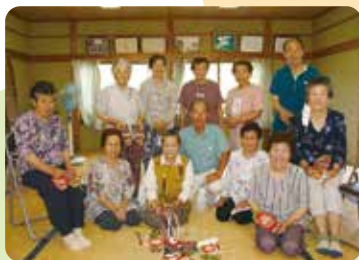
穴川・鳳来区サロンのみなさん