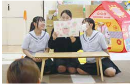
笑顔で読み聞かせ（菊池高校生）

菊池高校には「地域探究コース」があり、地域課題や地域活性化に関する体験的な活動を通じて学ばれています。地域の福祉について触れ、将来の目標につながれば幸いです。