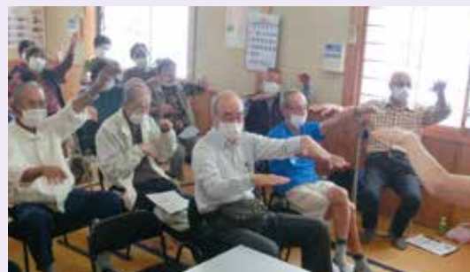
頭も体も動かします

百歳体操は、体力測定やその結果の分析を、熊本リハビリテーション病院の理学療法士が行っています。自分の身体の状態を確認しながら、筋力アップを目指しましょう!