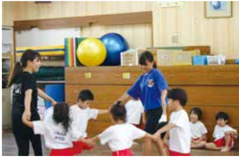
明るく楽しく体験（保育園にて）

「新しい友達ができた。普段は使わない手話を教わり、新鮮に感じた」「楽しく福祉について学びました」といった声があり、とても有意義な機会となったようです。