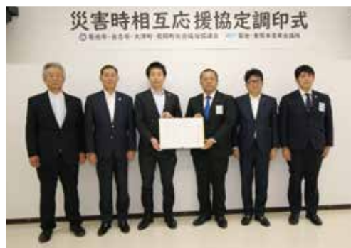
菊池ブロックの社協会長と青年会議所の代表

菊池ブロック（菊池市、合志市、大津町、菊陽町）の社会福祉協議会と菊池青年会議所、東熊本青年会議所との間で、災害時相互応援協定が締結されました。この協定は、災害時に社協が設置する災害ボランティアセンターに対して支援を行い、被災地域の復旧・復興へ寄与することを目的としています。災害からの復旧・復興活動には、多くの支援を必要とします。今回の協定締結により、より良い活動ができることが期待されます。