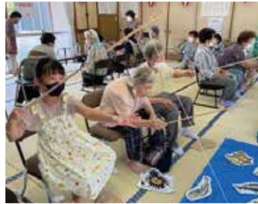
レクリエーションは地域の交流に役立ちます