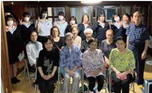
菊池高校生と立町老人会のみなさん

古民家を再利用した立町区のtate.base（タテベース）にて菊池高校の地域探究コースの生徒と立町老人会のみなさんが、交流会を行いました。地域の方々と交流や意見交換を通じて、菊池の良いところや課題などをいっしょに考えたいと、今回の交流会が実現。昔はこの付近にも映画館やボウリング場などがあったことを聞き、高校生は驚いていました。「元気な方々で、とても楽しかった」「菊池の昔のことを地域の高齢者から直接聞いて良かった。今後の菊池のことを考えるキッカケとなった」と参加した高校生は話していました。また立町の高齢者から、「あいさつから明るい地域づくりが始まる。笑顔で気軽に声をかけてほしい」とアドバイスを受けていました。