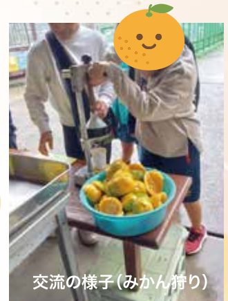
交流の様子(みかん狩り)