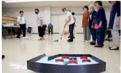
手作りレクリエーション道具を体験

「地域に帰り、紹介したい事ばかりで、笑い合い・笑いあふれる場所作りができれば。また、サロンに参加したいと思われるようにしたい」「サロン実践者からは参考になりました。助け合い体験ゲームは、『自分にできること』が整理できて良かった。色々考えるキッカケになりました」「手作り道具には関心しました。私も真似て作ってみます」といった声がよせられました。