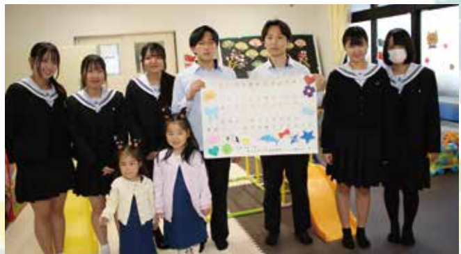
菊池高校地域探求コースの皆さん

ひだまり(菊池市福祉会館内) ☎080-1714-9818 あいあい(こども健診センター・2階) ☎090-6893-5971 ひなたぼっこ(七城老人福祉センター内) ☎090-8916-4666