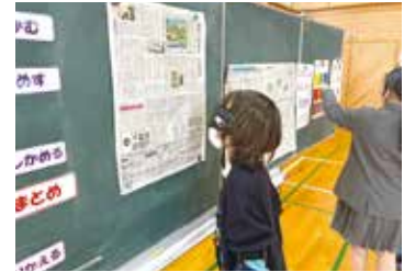
白内障の疑似体験

花房小学校では恒例となっている福祉体験学習が、今年も花房地区社協の皆さんの協力のもと行われました。5・6年生が、高齢者疑似体験や車いす体験、視覚障がい者体験を通して自分にできることや地域の高齢者や障がいのある人とのコミュニケーションについて学びを深めました。「困っているお年寄りがいたら手助けしたい」「明るくあいさつして笑顔にしたい」と感想を発表してくれました。