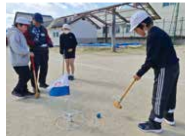
ホールインワンは出たかな？

高野瀬地区、花房地区、戸崎地区でもそれぞれ趣向をこらした「送る会」が行われました。