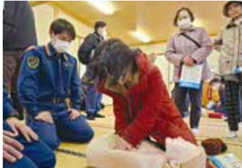
救急法を学ぶ中原区の皆さん

防災に力を入れている中原区で、区民約35名が参加し防災訓練が行われました。消火訓練や救急法、VR(バーチャルリアリティ)体験などの後、熊本地震ドキュメント動画「まけんばい菊池 まけんばい熊本」をみんなで鑑賞。「10年前を思い出し感慨深いものがあった」「みんなで助け合って復興したんだと改めて実感した」などの声が聞かれ、日頃の備えや地域住民同士のつながりの大切さを共有しました。