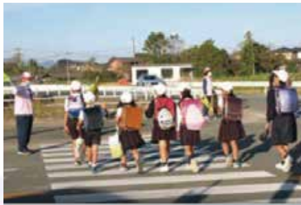
民生委員による見守り活動

「民生委員」は、社会福祉の増進のために、地域住民の立場から生活や福祉全般に関する相談・援助活動を行っています。全ての民生委員は「児童委員」も兼ねており、妊娠中の心配ごとや子育ての不安に関する様々な相談や支援も行っていきます。地域住民の身近な相談相手となり、支援を必要とする住民と行政や専門機関をつなぐパイプ役です。心配ごとや不安、困ったことがあるときは、お気軽にご相談ください。