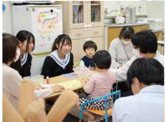
高校生がインタビュー

「結婚して慣れない土地にきたので知れ合いもおおらず大変だった」と話すのは、つどいの広場を利用していらっしゃるお母さん。菊池高校地域探求コース福祉班の2年生(当時)のインタビューに答えました。 ここは、0歳から就学前の親子の子育てをサポートする「つどいの広場」。菊池市内には3か所あり、子育て講座や読み聞かせ会、季節の行事など各イベントも開催しています。親子で楽しめ、ゆつくり気軽に過ごせる場所です。また、子どもが遊んでいるそばでスタッフが子育てや家庭の悩み相談にも応じています。