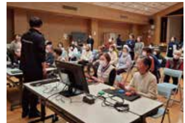
UDe-スポーツに思わず熱中

七城地区でサロン活動や百歳体操を通して介護予防に取り組んでいる皆さんが集まり、交流会を行いました。それぞれの活動について情報交換した後、全国的に注目されている『UDe-スポーツ』を体験しました。「新たな発見があった」「活動の工夫や楽しみ方が共有できた」「UDe-スポーツが広がって欲しい」など、サロン活動の新たな在り方に期待の声が聞かれました。