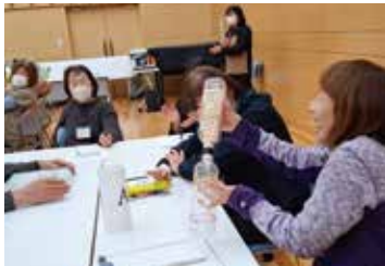
簡単に面白いゲームが作れる！

地域のサロンなどで活用できるレクリエーションを学び合おうと、「サロンレクリエーション講習会」を開催しました。これは、社協が昨年8月から全4回シリーズとして主催してきたものです。参加者からは「実際に他のサロンでやっているゲームを紹介してもらって参考になった。さっそく取り入れます」と好評でした。今後も地域サロンの活動を支援してまいります。