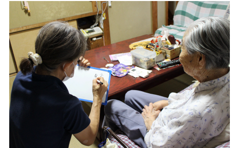
～困り事の支援をしている様子～