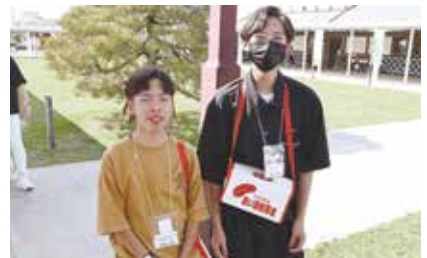
菊池こころのネットワークフェア ボランティア