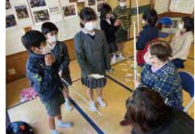
魚釣りゲームで楽しむ

今区のサロンで、戸崎小学校との交流会が開催されました。今回の4年生との交流会では、子どもたちが手作りした魚釣りゲームを楽しめました。釣った魚にクイズやなぞなぞが書かれており、釣れる度に会話が広がりました。また、子どもたちから手作りの年賀状をプレゼントされ、「小学生との交流はいつも楽しい」と今区の高齢者は、みな笑顔で話されていました。