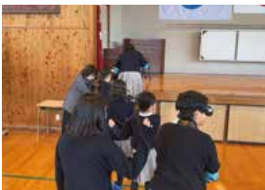
高齢者疑似体験をする子どもたち

菊池北小学校の4年生が福祉体験学習を行いました。車イスの体験、高齢者疑似体験を通じて、福祉のこころに触れることができました。「体験で高齢者の気持ちが分かった」「今日分かったことを高齢者と話すときに役立てたい」「友達が骨折などして車椅子を使う時はお手伝いしたい」と、子どもたちは明るい表情で話していました。