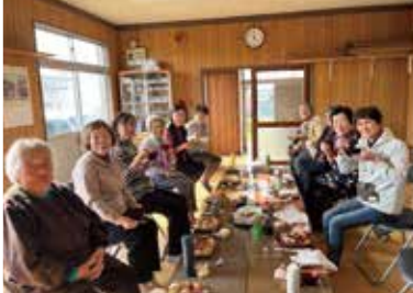
手作りぜんざいに舌鼓(忘年会の様子)

「足が痛くて近所でも車を使っていたが、今は歩くことも増えた」「足のしびれが緩和した」「週1回の楽しみになった」など嬉しい声が広がっています。