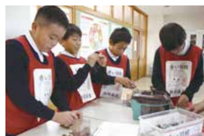
集まった募金を確認するボランティア委員会 (隈府小学校)