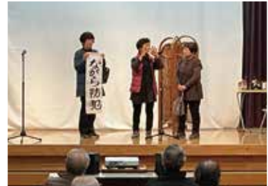
ふくし劇の一コマ(きくもん福祉ネットワーク)

地域福祉委員の研修を開催。きくもん福祉ネットワークの有志によるふくし劇を観ていただき、にこにこサービス(有償ボランティア)について学んでいただきました。「とても分かりやすかった。"ながら防犯"や詐欺の防止などとても為になった」「近所とのコミュニケーションは大事。犯罪防止にもつながる」「無理なく出来るサポートがあることに気づくことが出来た」といった声が聞かれました。